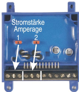
Abbildung 2: Einstellung der Stromstärke Illustration #2: Adjusting the trigger amperage