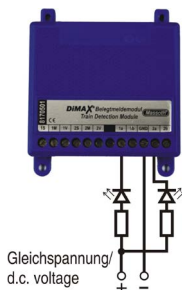
Abbildung 3: Anschluss einer optischen Anzeige Illustration #3: Hook-up of a visual display

The outputs operate as open collector against GND.