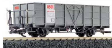
LE41930 SF-Güterwagen rot